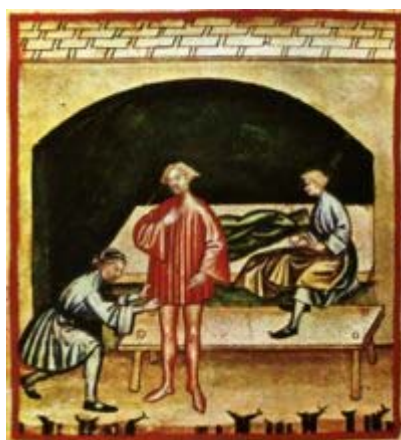
Abiti di Lana (Vestis Lanaea)

Butlan di Baghdad, un medico del XI secolo) e integrato con altri fonti, tradotti dall'arabo al latino, ed appartengono ad un genere di letteratura essenzialmente pratica. Sono rivolti ad un pubblico laico colto, e solo nominalmente si possono definire testi medici. Alcuni di questi "Tacuina" (codici miniati) sono giunti fino a noi; tre di questi sono considerati di maggiore pregio: uno è conservato a Vienna (Nationalbibliothek), uno a Parigi (Bibliothèque nationale de France) e un altro a Roma (Biblioteca Casanatense), il quale prende il nome, diversamente dagli altri due, di "Theatrum sanitatis".