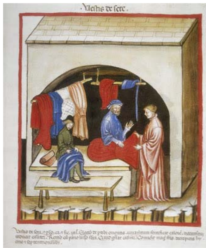
Anonimo di scuola lombardo-veneta, la bottega del sarto miniatura dal "Tacuinum Sanitatis" di Vienna (Vindob. Ser. n. 2644), 1385 ca. Vienna, Biblioteca Nazionale

I "Tacuinum Sanitatis" erano manuali medici sul benessere sulla base del Taqwim al-sihha (الصحة تقويم) ("mantenimento della salute"), basati su scritti derivati da testi arabi (di Ibn